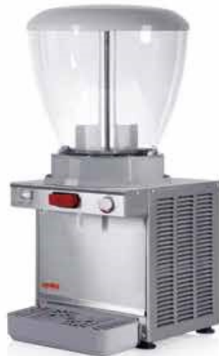
A - 19