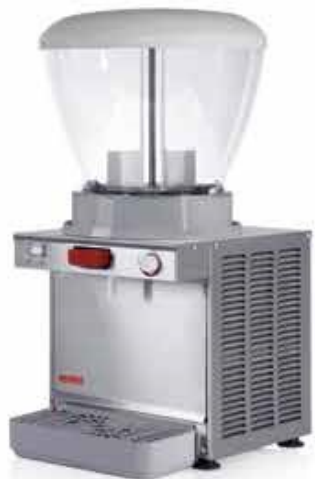
A - 12