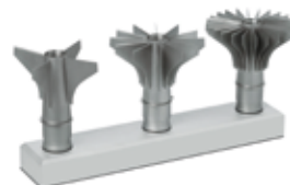
Abstellrichtung mit Zerteilsternen / Storage of Dividing Stars