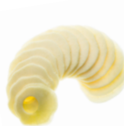
Scheiben / Slices