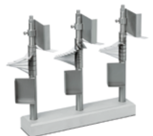
Abstellrichtung mit Fächermessersätzen / Storage of Fan-Type Knife sets