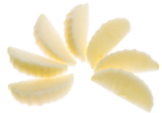
Spalten / Wedges