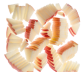
Apfelstücke / Apple pieces